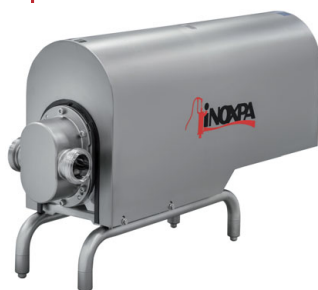
Pompe à lobes rotative TLS avec capot